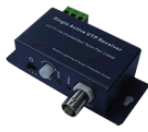
迷你式视频接收器