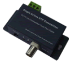
迷你式视频发送器